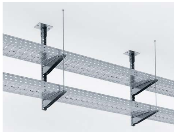
Крепление лотков на сборном одностороннем подвесе и консоли