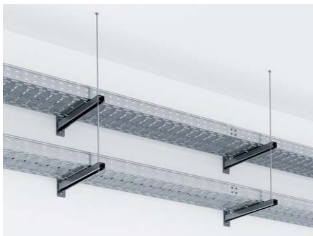
Крепление лотков на кронштейнах к стене