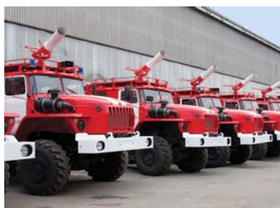
Подразделение пожарной охраны