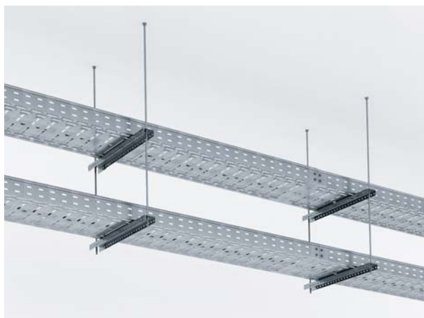
Крепление лотков на двух шпильках и профиле